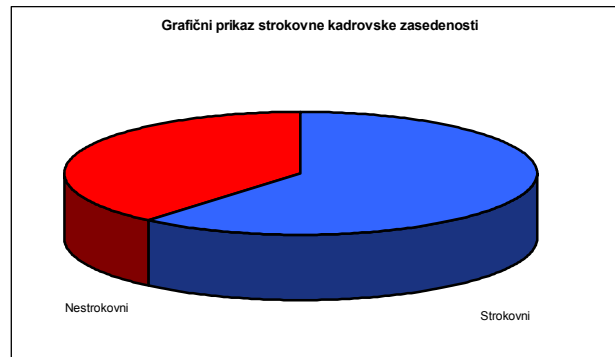
Tabela 6: Grafični prikaz strokovne kadrovske zasedenosti

31. 12. 2010 je bilo v knjižnici zaposlenih 44 delavcev, od tega trije za polovični delovni čas. Delavcev s strokovnim izpitom je bilo 28, kar je 63,63 %.