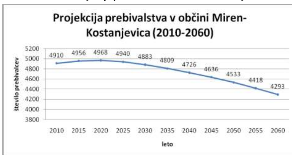
Slika št. 4: Projekcija prebivalstva v občini Miren-Kostanjevica.

V sorazmerju s projekcijo prebivalstva Slovenije, podano s strani Eurostata, smo izdelali projekcijo prebivalstva tudi za občino Miren - Kostanjevica.