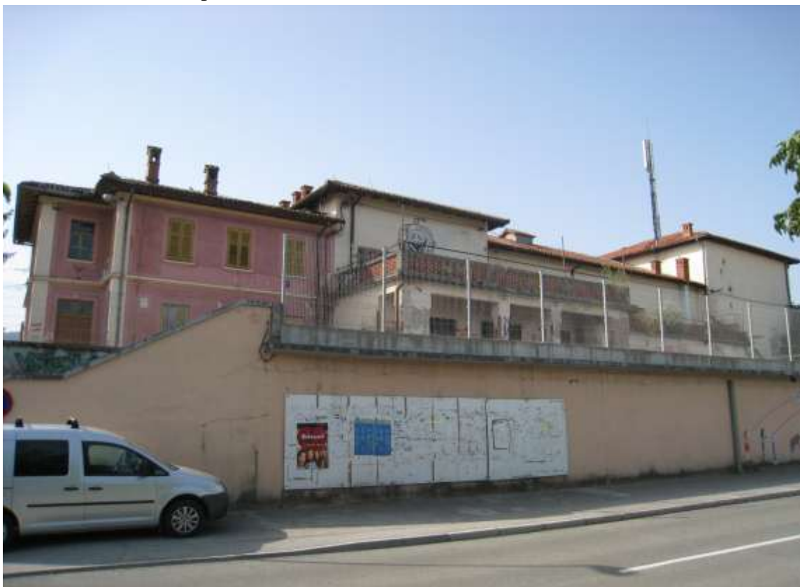
Slika št. 1: Kulturno upravni center Miren