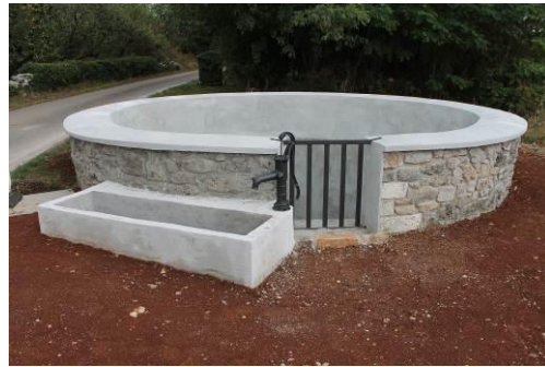
Korita na Krasu