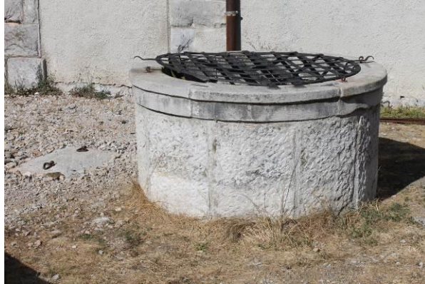
Kostanjevica na Krasu