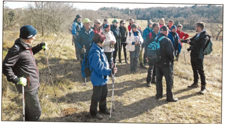
Matični Kras ima vse pogoje za celoletni turizem.