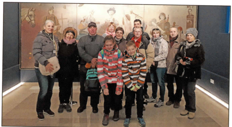
Pomnik miru na Cerju je eden od nosilni stebrov tako občinskega turizma kot tudi za cel Kras.