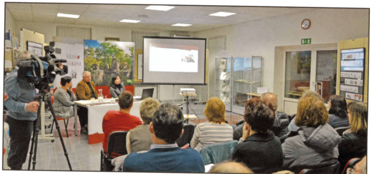
Dobro obiskani tematski večer je potrdil ključno povezovalno vlogo turističnih vodnikov v sodobnem turizmu.