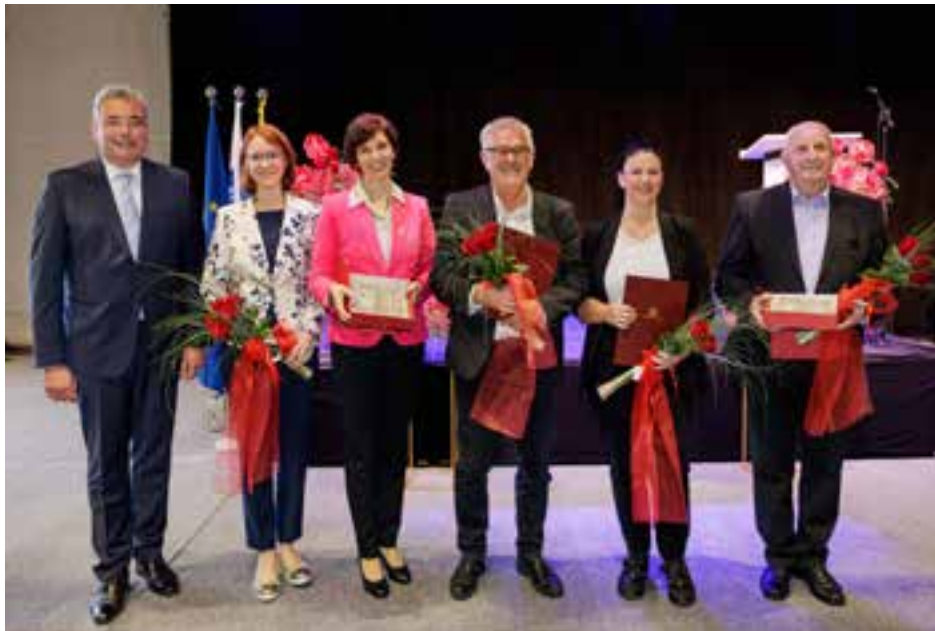
Občinski nagrajenci in župan

Občina Miren - Kostanjevica v letu 2024 obeležuje že tri desetletja delovanja. Uvod v praznično dogajanje se je odvil s slavnostno sejo občinskega sveta.