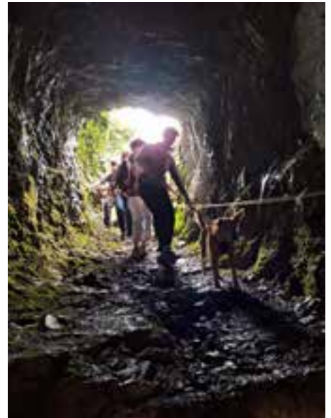
ŠKT Farjovca

Hvala vsem donatorjem, Jamarskem klubu Temnica in Vaški skupnosti Vojščica.